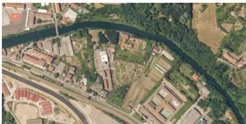
Gunearen aireko ikuspegia 2010ean.

2015eko eta 2018ko irudien artean, ikus daiteke Urumea ibaitik hurbil dagoen landarediaren eta zuhaitzen zati bat kendu zela, uholdeak egotekotan ahalmen hidraulikoa hobetzeko. Aldi horretan zehaztu zen ibai-parkearen eremua, eta Txomin Eneko hirigintza-garapenetik bereiztu zen.