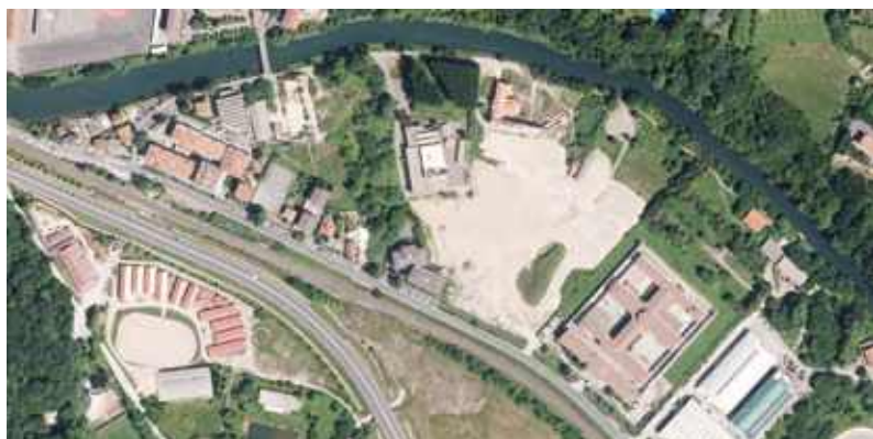
Gunearen aireko ikuspegia 2015ean.