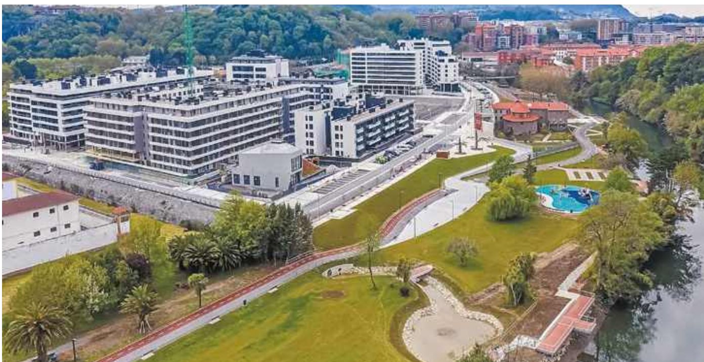
Gunearen egungo aireko ikuspegia (2022. urtea), Txomin Enea hirigintza-garapenaren ondoko ibai-parkea.

Txomin Enea ibai-parkea sortzea 2015 eta 2020 urteen artean Urumeako uholdeen aurkako planaren barruan egin diren hainbat esku-hartzeren emaitza da. Egindako esku-hartzeen artean, honako hauek nabarmendu daitezke: Espartxoko zubia ordeztzea, Txomin auzo berria kota altuago batean eraikitzea, eta zenbait eraikin eraistea, hala nola Goicoenea baserria, zenbait berotegi, Moja Frantziskotarren komentuaren eraikinaren zati bat (Kristobaldegi pasabidean dagoena) eta Tintorerias París eta Mayo y Goenaga enpresa zaharrak.