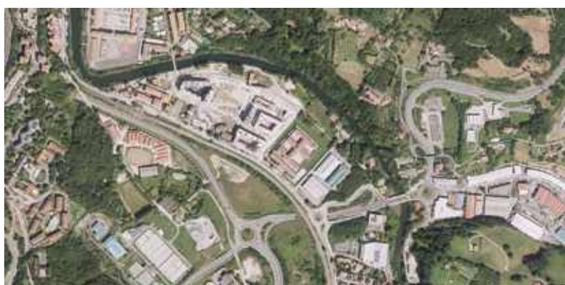
Gunearen aireko ikuspegia 2018an.