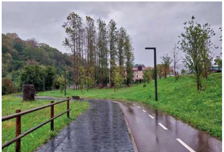
Ibai-parkerako oinezkoen sarbidea.