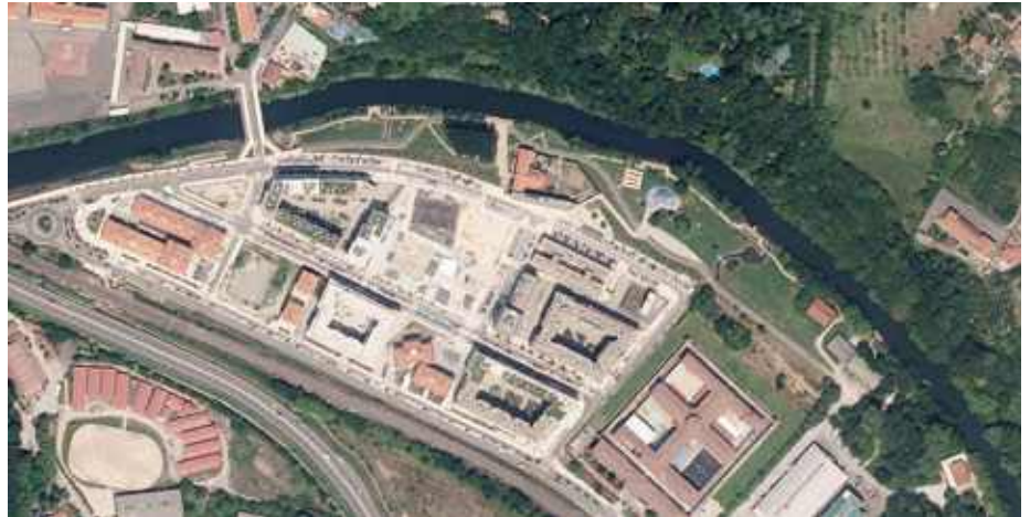
Gunearen aireko ikuspegia 2022an.

Ibai-parkeak gutxieneko hiri-ekipamendua du, hala nola eserlekuak, paperontziak eta abar, uraldietan fluxua ez oztopatzeko.